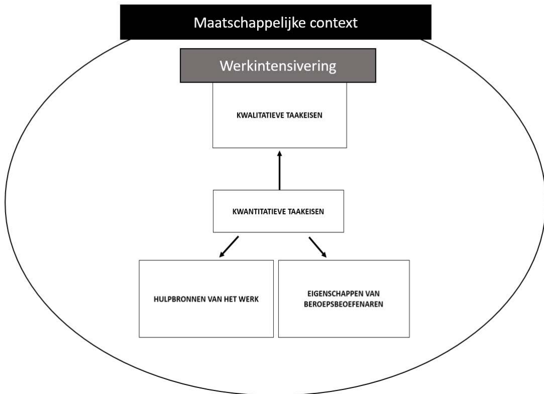
Figuur 1. Het onderzoeksmodel: Werkintensivering als een wisselwerking van vier aspecten, te beschouwen binnen een bredere maatschappelijke context.