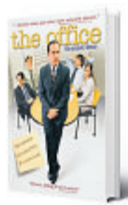
● Iets om naar uit te kijken: de producers van de reeks The Office US komen met een serie over thuiswerken.