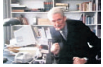
● Van Kooten en De Bie wisten in 1986 al waar thuiswerk toe leidt. 'Dit is een bom onder het kantoorgebeuren.'