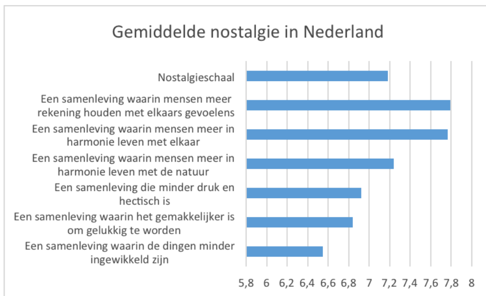
Figuur 1 Gemiddelde nostalgie in Nederland (N=1920)

zijn de verlangens toch vooral geënt op een hang naar de overzichtelijkheid van vroeger 3 . Vooral op de vragen waarin ingegaan wordt op de onderlinge verhoudingen in de samenleving, laat men een nostalgisch verlangen naar meer harmonie zien. Ook op de overige vragen scoren de ondervraagden ruim boven het theoretische midden van 5,5. De gemiddelde score op de samengestelde schaal is dan ook een dikke 7. Gemiddeld genomen laat deze representatieve uitsnede van de Nederlandse bevolking dan ook zien nostalgische denkbeelden te omarmen.