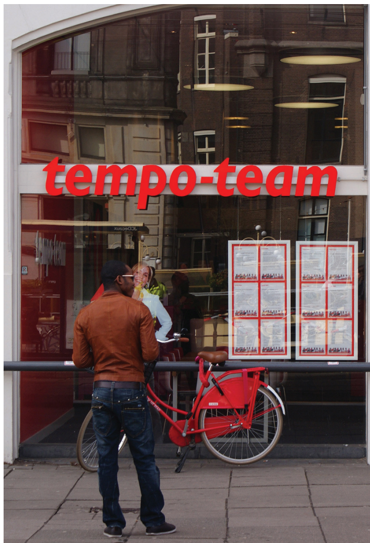
Tijdelijk werk is voor 'kwetsbare groepen' niet automatisch een zegen

Op basis van dit onderzoek lijkt de belofte van een flexibele arbeidsmarkt: minder baanzekerheid maar meer werkzekerheid dus een valse. Het gebrek aan baanzekerheid van tijdelijk werk wordt gemiddeld niet of nauwelijks gecompenseerd door meer werkzekerheid in de zin van een kortere werkloosheidsduur. Verder valt te vrezen dat de positieve effecten (doorstroom naar vast werk) van tijdelijk werk voornamelijk te vinden zijn bij werkenden die toch al een gunstige arbeidsmarktpositie hebben en dat de negatieve effecten (vaker werkloos) voornamelijk gelden voor diegenen met een minder florissant perspectief. Tijdelijk werk is dus voor 'kwetsbare groepen' niet automatisch een zegen.