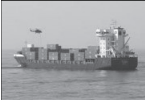
Het Duitse vrachtschip MS Taipan

vijf jaar. 8 Deze zaak wordt beschouwd als een mijlpaal in de strijd tegen de Somalische piraterij, omdat Nederland als eerste Europese land erin geslaagd is Somalische piraten te berechten. Naast de Samanyolu -zaak was er vorig jaar nog een andere zaak in Nederland. Op 4 april 2010 werd het Duitse vrachtschip MS Taipan aangevallen door tien Somalische piraten. De Nederlandse marine greep in en arresteerde de piraten. Zij werden naar Nederland overgebracht, waarna het Amsterdamse Hof van Justitie de tien uitleverde aan Duitsland. Het proces is inmiddels in Hamburg begonnen; de tien piraten hangt een gevangenisstraf van maximaal 15 jaar boven het hoofd. In de Verenigde Staten zijn afgelopen jaar ook een aantal Somalische piraten veroordeeld; ze hebben gevangenisstraffen gekregen van respectievelijk 36, 33 en 30 jaar. In Jemen zijn zes Somalische piraten ter dood veroordeeld, terwijl zes andere piraten een gevangenisstraf van 10 jaar hebben gekregen. Op 21 januari 2011 werd een Koreaans schip gekaapt door een groep Somalische piraten. De marine van Zuid-Korea greep in en arresteerde vijf Somalische piraten, die naar Zuid-Korea zijn overgebracht om daar terecht te staan.