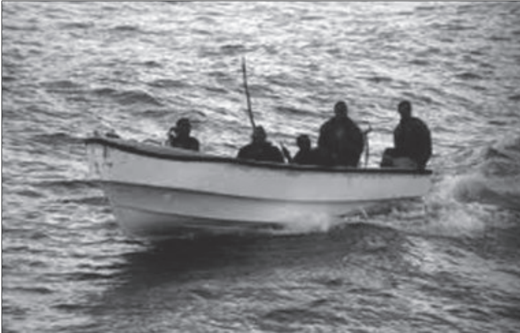
Somalische piraten in actie