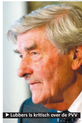
► Lubbers is kritisch over de PVV