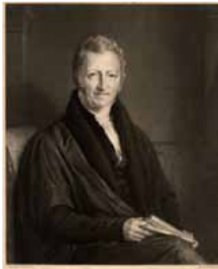
Thomas Robert Malthus 1766 – 1834

De centrale stelling in het werk van Malthus is dat de draagkracht van de aarde in termen van voedselvoorziening de groei van de bevolking niet zou kunnen bijhouden. Tenminste, als mensen zich als konijnen ongehinderd zouden vermenigvuldigen. In de praktijk zijn er echter wel remmende factoren en de groei van de bevolking wordt volgens Malthus beteugeld door 'misery and vice': ellende als hongersnood, oorlog en ziektes en ondeugden als abortus en het gebruik van voorbehoedsmiddelen. Dat was een harde en weinig bemoeidigende boodschap. Malthus verbond aan zijn bevolkingstheorie ook een boodschap voor beleidsmakers door kritiek te uiten op het gedecentraliseerde stelsel van sociale zekerheid van zijn tijd: de Poor