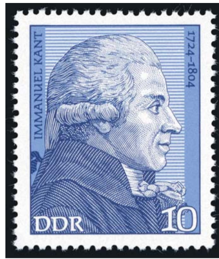
Immanuel Kant op een postzegel uit de voormalige DDR.

Plessner wees op de Sonderstellung van de mens, en verschillende empirische wetenschappen doen dat nu ook. Deze nadruk op het bijzondere van het menselijk cognitief functioneren is iets van grofweg de afgelopen vijftien jaar. Voordien richtten wetenschappers zich veel meer op de continuïteit met andere soorten.