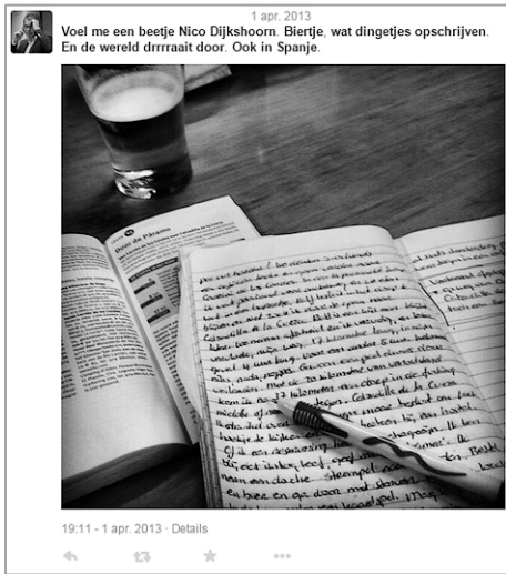
Afbeelding 1: Tweet met foto van het dagboek van een pelgrim

auteur nog in het dagelijks leven staat en de beelden uit zijn dagelijks leven bij zich draagt!), maar door de foto van zijn dagboek toe te voegen verwijst hij naar het medium waarin de daadwerkelijk belangrijke verhalen worden getoond. Hij tweet een foto van zijn dagboek en vertrouwt op de autoriteit van het handgeschreven verhaal om te verwijzen naar zijn meer serieuze overwegingen. 32