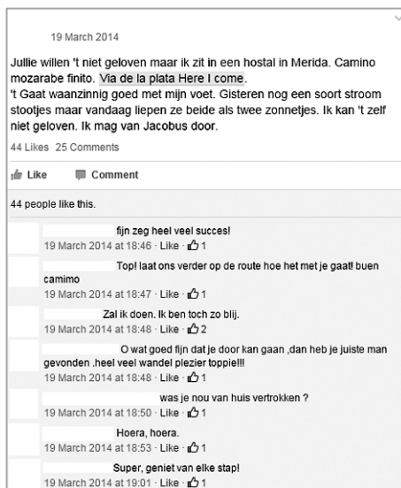
Afbeelding 4: Bericht in Facebookgroep voor pelgrims

Facebook kan gebruikt worden om te vertellen over problemen die zijn overwonnen, of die zeker zullen worden overwonnen in de ( nabije) toekomst. Vrijwel nooit vinden we foto's van de kilometers langs snelwegen of door industriegebieden of verhalen over de pijnlijke en onzekere ontdekkingen die de pelgrim over zichzelf doet. Deze verhalen beslaan een groot deel van de pelgrimage vinden vaak alleen hun weg tot Facebook wanneer ze vertaald kunnen worden naar een moment van overwinning. Het idee van lijden dat via Facebook en andere online media wordt verspreid onder pelgrims is dus uitgesproken anders dan het omarmen van ongemak ter meerdere glorie van een hoger doel. De moderne pelgrim wil pijn erkennen als noodzakelijke hindernis op het pad van zelfontplooiing. Het lijden van de moderne pelgrim is geen doel op zichzelf, het functioneert als obstakel dat bestaat om overwonnen te worden, zodat de pelgrim als beter mens van zijn tocht terug zal keren.