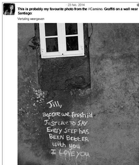
Afbeelding 2: Tweet met foto van graffiti op een muur in de buurt van Santiago

Een laatste manier om met weinig woorden veel te zeggen, of om snel iets ‘veelzeggends’ te communiceren, is via foto’s. Dit lijkt verreweg de meest gebruikte strategie en deels ingegeven door de aanwezigheid van het publiek; om de lezer te plezieren, zorgt de pelgrim er vaak voor het verhaal zo aantrekkelijk mogelijk te maken. Een gemakkelijke manier om dat te doen is via foto’s. Beelden spreken mensen aan en met name de huidige lezer is eraan gewend om via beelden toegesproken te worden. Zie bijvoorbeeld de tweet in Afbeelding 3. 35 Zonder woorden vertelt het ons over de vrijheid, de natuur, de buitengewone omstandigheid waarin de pelgrim zich bevindt. Alleen de #Camino is nodig om het beeld te contextualiseren. Sacraliteit is dus nog steeds een belangrijk element van een pelgrimage, maar wordt meer en meer verweven met de meer alledaagse kanten van een pelgrimstocht.